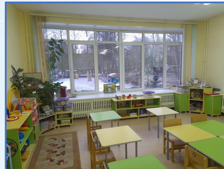
Фотографии состояния «До»