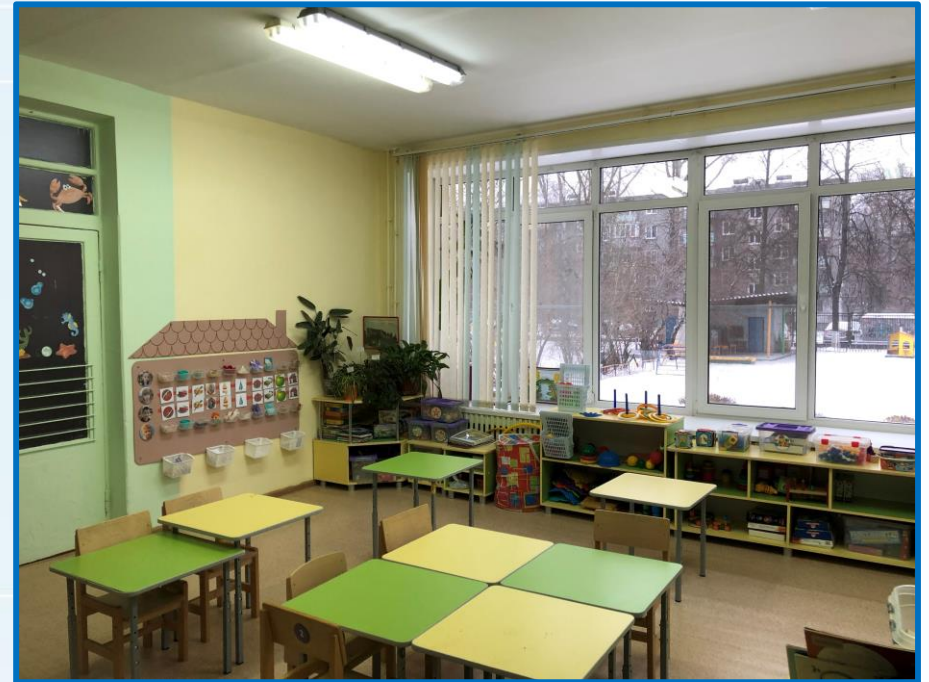
Фотографии состояния «После»