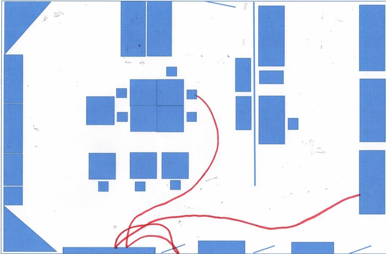
Диаграмма «Спагетти» целевого состояния процесса